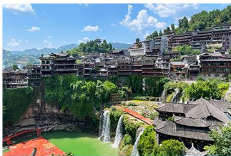
เมืองโบราณ ฝูหรงเจิ้น