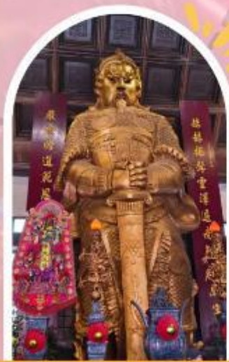
วัดแซกง ขอพรโชคลาก การเงิน และธุรกิจ