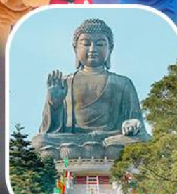
พระใหญ่โป้วหลิน