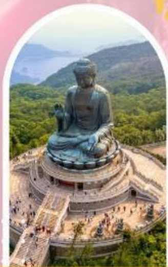
นั่งกระเช้ามองปิง นมัสการพระใหญ่โป่วหลิน