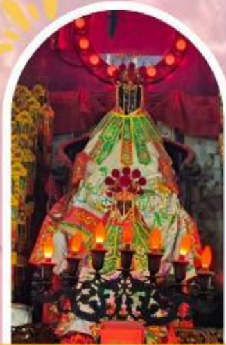
วัดเจ้าแม่กวนอิมฮ่องกง ขอพรเรื่องเงิน ทรัพย์สิน และความมั่งคั่ง