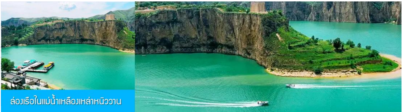
ล่องเรือในแม่น้ำเหลืองเหล่าหนิววาน

เที่ยง รับประทานอาหารกลางวัน ณ ร้านอาหารระหว่างทาง (8)