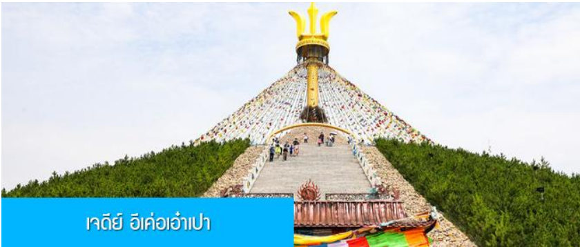
เจดีย์ อี้ค้อเอ้าเปา

พักที่ DALAEQI SHNAGJING HOTEL โรงแรมระดับ 4 ดาวหรือเทียบเท่าในเมืองต้าลาเท่อ