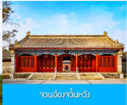
จวนอ๋องจวินหวัง

วันที่หก เมืองเออร์ดอส -อี้ค้อเอ้าเปา-พิพิธภัณฑ์เครื่องเงิน-จวนอ๋องจวินหวัง- สวนวัฒนธรรมหมงกู่หยวน หลิว-ซื้อปิ้งถนคนเดิน