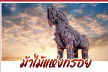
ม้าไม้แห่งกรอย