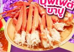
บุฟเฟ่ต์ ชาบู