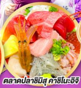
ตลาดปลาชิบิสึ คาชิโนะอิชิ