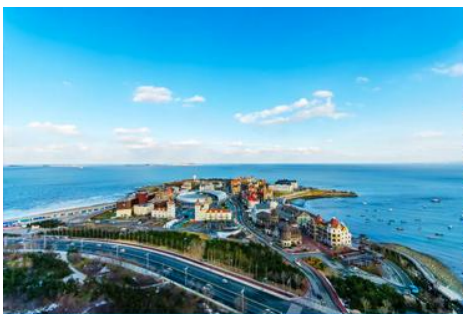
ท่าเรือชาวประมง

08.05 น. ถึงสนามบินเมืองเยียนไถ (เวลาที่ท้องถิ่นเร็วกว่าไทย 1 ชั่วโมง) นำท่านผ่านการตรวจตราเอกสารและรับสัมภาระเรียบร้อย นำท่านเดินทางโดยรถบัสปรับอากาศ เดินทางสู่เมืองเยียนไถ