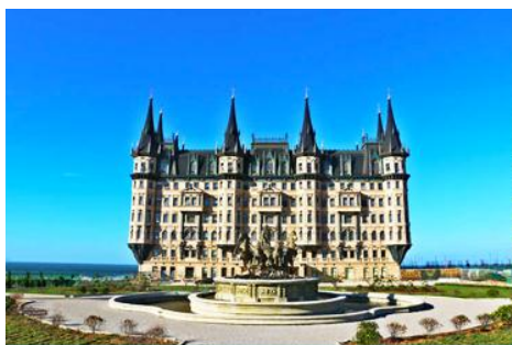
คฤหาสน์เหวินเจิง

นำท่านไปเยือนเมืองท่าสุดโรแมนติคสไตล์ยุโรป ท่าเรือชาวประมง ให้ท่านได้ชมสถาปัตยกรรมสไตล์อเมริกาเหนือ และ ยุโรป ที่ตั้งอยู่ในผืนแผ่นดินจีน ณ เมืองเยียนไถ เก็บบรรยากาศลมทะเล และเก็บรูปกับอาคารหลังคาสี่เสดเป็นฉากหลัง ที่เต็มไปด้วยมนต์เสน่ห์และความทรงจำที่สวยงาม ให้ท่านเก็บภาพความสวย