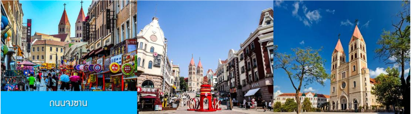
ถนนจงซาน

หลังอาหารนำท่านเดินทางชม สะพานจ้านเจียว เป็นแลนด์มาร์กประวัติศาสตร์คู่เมืองชิงเต่า สร้างเมื่อปี ค.ศ. 1891 มีลักษณะเป็นสะพานหินทอดยาวกว่า 440 เมตรสู่ทะเล ปลายสะพานมีศาลา ทรงแปดเหลี่ยมสีแดงที่โดดเด่น ซึ่งเป็นสัญลักษณ์บนฉลากเบียร์ชิงเต่า ขึ้นชื่อเรื่องวิวสวย รับลมทะเล ให้ท่านเก็บภาพบรรยากาศ จากนั้นนำท่านเดินเที่ยวชม ถนนจงซาน 中山路 ถนนที่เต็มไปด้วยกลิ่นอายยุโรป และถนนสายนี้มีบันทึก เรื่องราวมากกว่าศตวรรษของเมืองชิงเต่าไว้ ที่นี่เป็นศูนย์กลางการค้าแห่งแรกที่เต็มไปด้วยสถาปัตยกรรมสไตล์ ยุโรปเก่าแก่ที่ได้รับอิทธิพลมาจากเยอรมัน ให้ท่านได้เดินเก็บบรรยากาศ และ เก็บภาพกับ โบสถ์เซนต์ไมเคิล (ด้านนอก) โบสถ์แห่งนี้ที่คู่รักนิยมมาถ่ายภาพงานแต่งงานกันมากที่สุดในเมืองชิงเต่า ให้ท่านถ่ายรูปเก็บภาพ จากนั้นเดินทางต่อ สู่ย่าน เมืองเก่าเยอรมัน ตรอกกว้างชิงหลี่ 广兴里 ตรอกชอกชอยที่เรียงรายไปด้วยอาคาร สถาปัตยกรรมแบบ ผสมผสานจีนและอาคารสไตล์ยุโรป