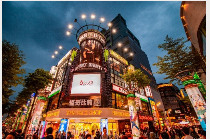
ตลาดกลางคืนซีเหมินติง (Ximending Night Market)

เย็น อิสระอาหารเย็นตามอัธยาศัย ณ ตลาดกลางคืนซีเหมินติง