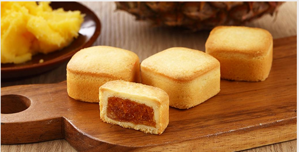
ร้านขนมพายสับปะรด (Taiwanese Pineapple Cake)

นำทุกท่านแวะชิม ร้านขนมพายสับปะรด (Taiwanese Pineapple Cake) ขนมที่ถือได้ว่ามีแหล่งกำเนิดมาจากเกาะไต้หวัน เนื้อแป้งหอมเนยห่อหุ้มแยมสับปะรด รสชาติมีความหวาน และความมันของเนยเล็กน้อย ผสมกับรสเปรี้ยวของสับปะรด ทำให้มีรสชาติที่กลมกล่อมจนเป็นที่นิยม ด้วยรสชาติที่เป็นเอกลักษณ์ไม่เหมือนใคร ทำให้ขนมพายสับปะรดเป็นขนมที่ขึ้นชื่อของเกาะไต้หวัน ไม่ว่าจะใครที่ได้มาเยือนก็ต้องซื้อเป็นของฝากติดมือกลับบ้าน นอกจากขนมพายสับปะรดแล้ว ยังมีขนมอีกมากมายให้เลือกชิม และเลือกซื้อ เช่น ขนมพระอาทิตย์ ขนมพายเผือก เป็นต้น อีสาระให้ทุกท่านเดินเลือกซื้อขนม