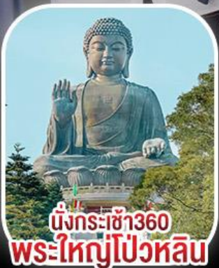
นั่งกระเช้า360 พระใหญ่โป้วหลิน