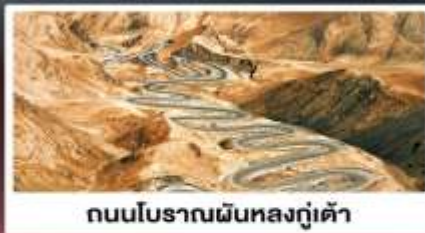
ถนนโบราณผืนหลงกู่เต้า