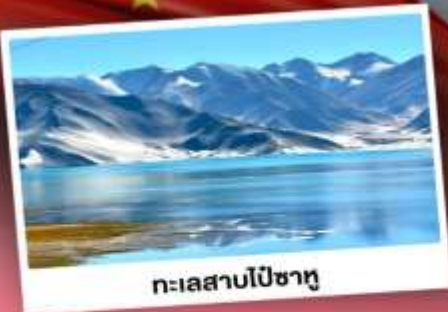
ทะเลสาบไปซาทุ

เปิดประตูสู่อารยธรรมพันปีแห่งซินเจียงใต้ ชมความสวยงามของหมู่บ้านดอกแอปเปิล