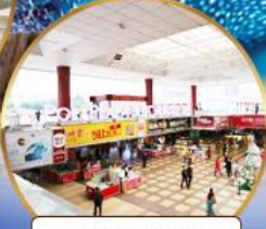
ตลาดกึ่งเป๋