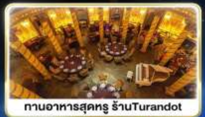
ทานอาหารสุดหรู ร้านTurandot