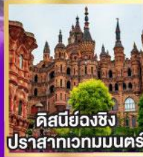
ดิสคัฟวอรีฉางชิ่ง ปราสาทเวทมนตร์