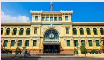
ไพรบ์นีย์กลางโฮจิมินห์