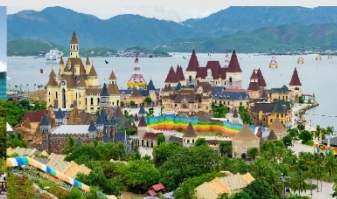
สวนสนุกวันเดอร์ส

*ทางบริษัทฯ ขอสงวนสิทธิ์ในการสลับโปรแกรมทัวร์ตามความเหมาะสมขึ้นอยู่กับสถานการณ์หน้างาน โดยคำนึงถึงผลประโยชน์ของลูกค้าเป็นสำคัญ