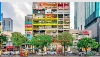
คาเฟ่ อพาร์ทเม้น