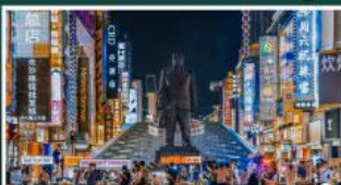
ถนนแดนเดินเขางิงคู่