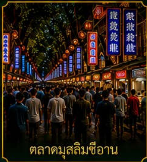
ตลาดมัสลิมซีอาน