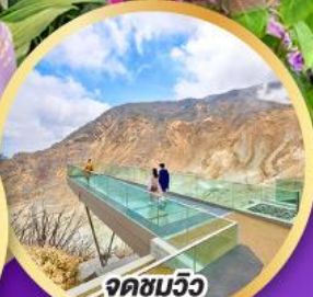
จุดชมวิวก EARTH VALLEY