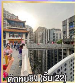
ตึกหุ่ยซิง (ชั้น 22)