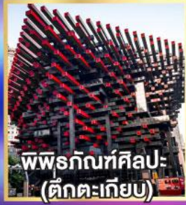
พิพิธภัณฑ์ศิลปะ: (ตึกตะเกียบ)