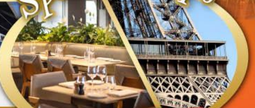
รับประทานอาหารกลางวัน บนหอไอเฟล