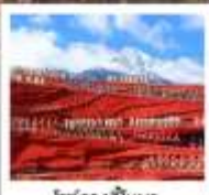
ไร่ชาฉางฮี้หนว

เมืองโบราณต้าหลี่ / เจดีย์สามองค์ / ไค้งร / หนงหลานเอ๋อไห่ / เมืองโบราณแซงกรีล่า / ซองเกนเสือกะโถด (รวมบินไต่เครื่องบิน-คง) / วัดสามะซงจ้านหลิง (รวมท่ารถข้าม-คง) ชมวิวยามค่ำกินเมืองโบราณลี้เจียง / ภูเขาหิมะมังกรหยก (มังกรง้อไห่ใหญ่) / หุบเขาพระจันทร์สีน้ำเงิน ไม้ศุ่ยเหอ (รวมรถกอล์ฟ) / ไร่ชาฉางฮี้หนว / เมืองโบราณไปซา นั่งรถไฟชมวิวรอบภูเขาหิมะมังกรหยก / สระมังกรดำ / คาเฟ่ไวน์ดีอัน YUN DI AN CAFE (รวมค่าเครื่องดื่ม) / เมืองโบราณลี้เจียง / ถนนคนเดินจินปี้ตู้