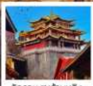
วัดสามะซงจ้านหลิง