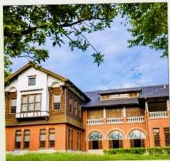
พิพิธภัณฑน์น้ำพุร้อนเป่ย์โถว