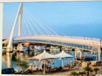
สะพานคู่รักตั้นสุ่ย