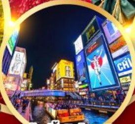
ช้อปปิ้งชินโซบาช