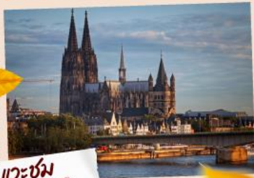
แควซ่ม มทาว์ซาร์โคโลญ