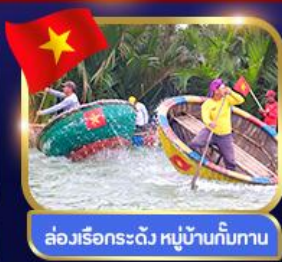
ล่องเรือกระด้ง หมู่บ้านกัมทาน