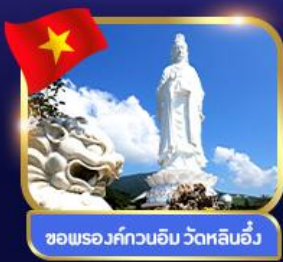
ขอพรองค์กวนอิม วัดหลินอึ้ง