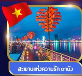
สะพานแห่งความรัก ดานัง