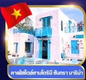
คาเฟ่สไตล์ซานโตรินี ชันตรา มาริน่า