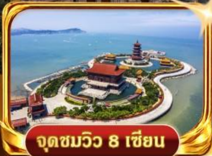
จุดชมวิวกว 8 เชียง