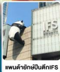
แพนด้ายักษ์ปีนตึกIFS