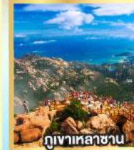
กุเขาเหลาซาน