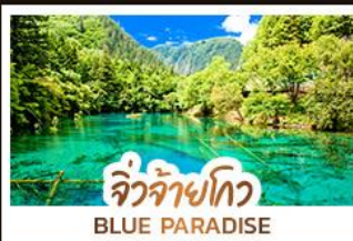
จิวจ้ายโกว BLUE PARADISE