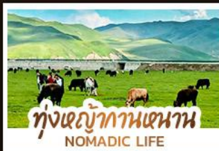
ทุ่งหญ้ากานหนาน NOMADIC LIFE