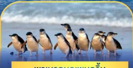
พาเหรดนกเพนกวิน