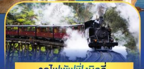
รถไฟพัพฟิงบิลลี่

ล่องเรือชมอ่าวซิดนีย์พร้อมรับประทานอาหารกลางวัน และ เข้าชมสวนสัตว์การองก้า