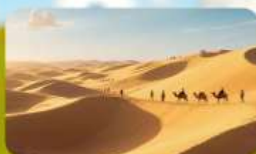
เนินทรายอินเคินทาลา