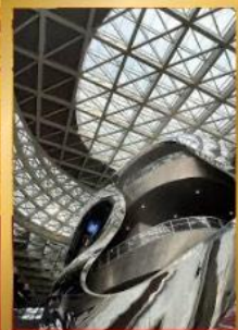
พิพิธภัณฑ์ศิลปะร่วมสมัยเซินเจิ้น

ชมสถาปัตยกรรมระดับโลก พิพิธภัณฑ์ศิลปะร่วมสมัยเซินเจิ้น (MOCAPE) และ Shenzhen Civic Center