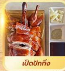
เปิดปีกทั้ง