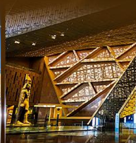
พิพิธภัณฑ์ไทรนด์อียิปต์ (GEM)