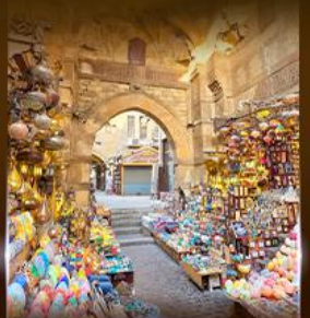
ตลาดฟานเวลกาลลี