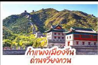
กำแพงเมืองจีน ด้านจวิ่งกวน

ล่องเรือสุดโรแมนติกแม่น้ำหวงผู้ ปักกิ่ง..เปิดประตูสู่แดนมังกร ด้วยความอลังการระดับจักรพรรดิ ชิงเต่า..เมืองชายทะเลสไตล์ยุโรป หอหุราแบบพ่นโคลาย เซี่ยงไฮ้..มหานครแห่งเอเชีย เมืองที่ไม่เคยหลับใหล