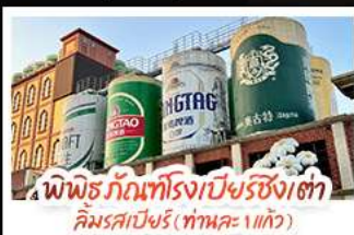
พิพิธภัณฑ์โรงเบียร์ชิงเต่า คิมรสเบียร์ (ทานคะ 1 แก้ว)