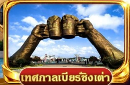
เทศกาลเบียร์ชิงเต่า