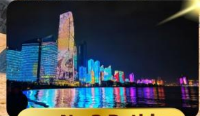
หาด No.3 Bathing

เมนูพิเศษ ซาบูสายพาน 6 วัน 4 คืน เดินทาง : พฤษภาคม 69