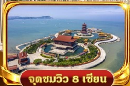
จุดชมวิว 8 เชียง