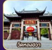
วัดหลงอา