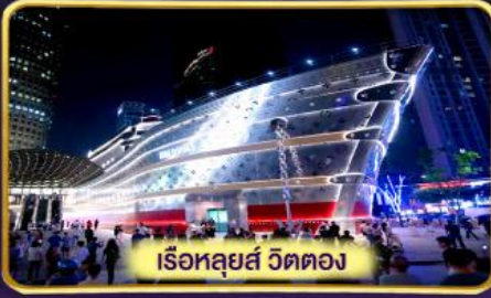
เรือหลุยส์ วัดตอง