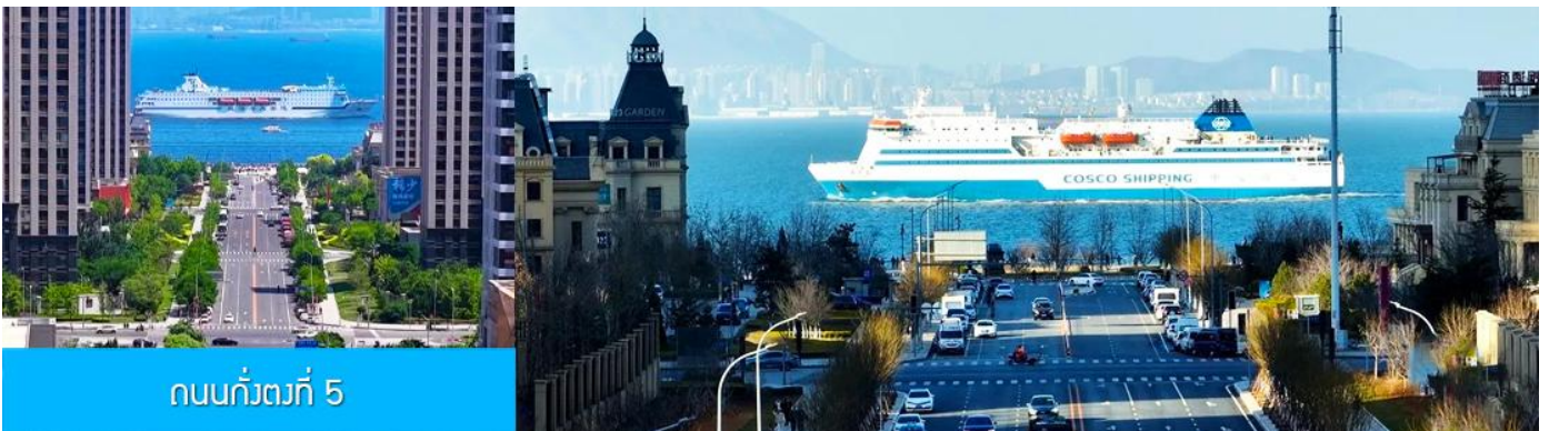
ถนนกั๋วตง 5