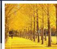
สวนเอ็งกโชโป