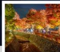
อุโมงค์เมบิล