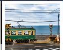
รถไฟโอบะเด็น