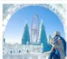
ICE & SNOW FEST.