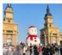
ตุ๊กตาหิมะยักษ์

โบสถ์ซันโฮเซ / คฤหาสน์วอลการ์ / โบลต์เซนต์ปีเตอร์สเบิร์ก / Harbin Polar Park หมู่บ้านหิมะ: SNOW TOWN + กิจกรรมสาดน้ำร้อนกลางแจ้ง / เซาเปียงตง DREAM HOME (รวมค่าเช่า) / สนเสงกักตักกิมกิมเน่ส์ญี่ปุ่นเจีย + สวนพญาเหอติสที่ กาฬเจียน ICE AND SNOW (ฟรี Snow Tubing ท่าเรือ: 1 รอบ) ถนนจงหยาง (ฟรี! ไอศกรีมหน้าตึกเอ๋อเอ๋อ) / เกาะพระอาทิตย์ (รวมรถแบดเจอร์) Harbin 2027 International Ice and Snow Festival / หอไอศกรีมฮาร์บิน อุป๋นตุ๊กตาหิมะยักษ์ + ระเบียงฉนวนดี / ทะพานกระจอกไฟประวิติศาสตร์