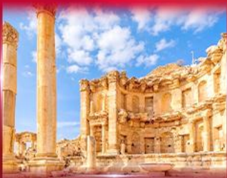
เมืองโบราณเพตรา