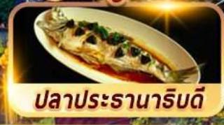
ปลาประรานาริบดี