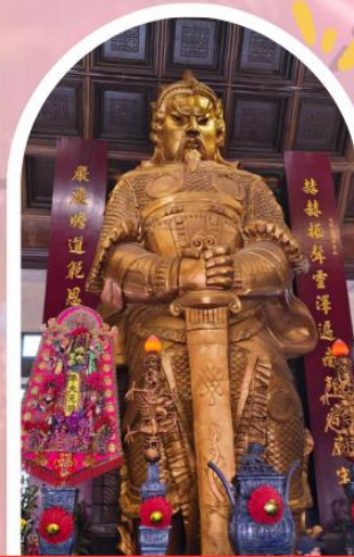
วัดเซกวง ขอพรโชคลาภ การเงิน และธุรกิจ