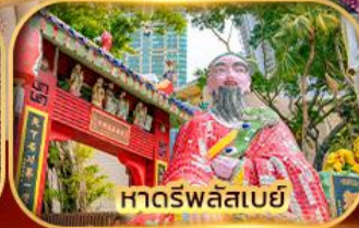
หาดรพลัสเบย์