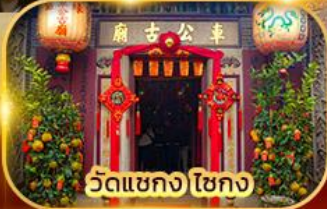
วัดแขก ไชกง