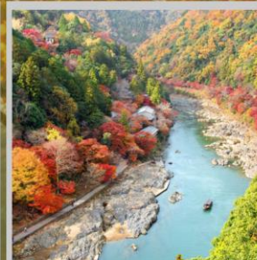
“ARASHIYAMA MT. KAMEYAMA”