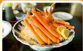
พิเศษ! ชาปู