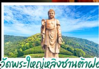
วัดพระใหญ่เฉิงชานต้าฝอ