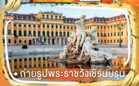
• ถ่ายรูปพระราชวังเซิร์นบรุน