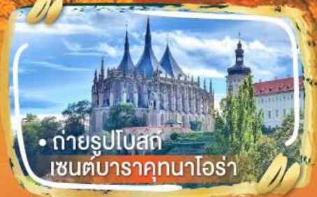
• ถ่ายรูปโบสถ์ เซนต์บาราคุกนาโอรา