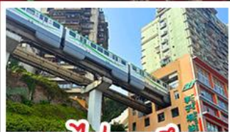
รถไฟทะลุคด