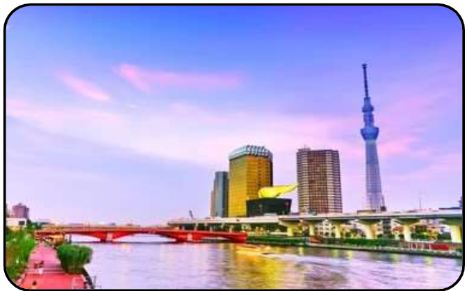
แม่น้ำสุมิดะ

สักการะ วัดมัตสึจิยามะโชเด็น หรือ “วัดหัวไชเท้า” ซึ่งเป็นวัดเก่าแก่ในย่านอาซากุสะ เป็นวัดเก่าแก่ในย่านอาซากุสะ กรุงโตเกียว ตั้งอยู่บนเนินเขาเล็ก ๆ ริมแม่น้ำสุมิดะ จุดเด่นคือเป็นวัดที่ขึ้นชื่อเรื่อง “ขอพรด้านการเงิน” โชคลาภ และความสำเร็จในธุรกิจ ส่วนไฮไลต์สำคัญของวัดนี้คือ ไคคอน หรือหัวไชเท้า สัญลักษณ์ศักดิ์สิทธิ์ คนที่นี้เชื่อว่าไคคอนช่วย “ชำระล้างสิ่งไม่ดี” และนำโชคลาภเข้ามา นักท่องเที่ยวมักนำไคคอนไปถวายเพื่อขอพร