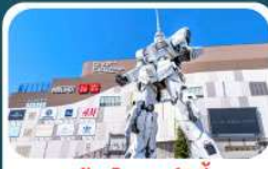
ห้างไดเวอร์ซิตี