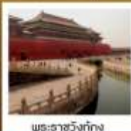
พระราชวังปักกิ่ง