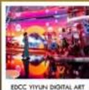
EDCC YIYUN DIGITAL ART